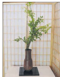
Eine klassische Ikebana-Komposition aus der Misho-Schule.