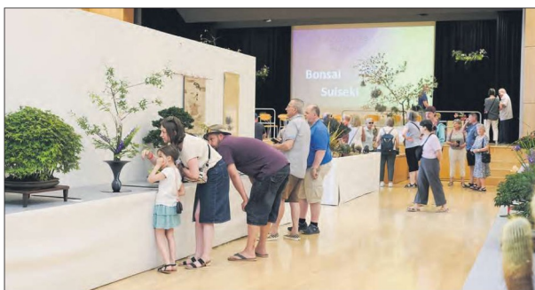
Die Ausstellung faszinierte Jung und Alt und erfreute mit den mehr und weniger bekannten Kunstformen das Publikum. Wer Lust daran bekam, konnte im Foyer auch Exemplare kaufen.

Bei dem Gesteck am Eingang handelt es sich um ein klassisches