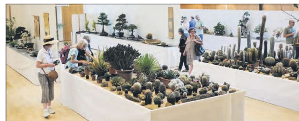
Kunstvolle Pflanzenkompositionen, fantasieanregende Steine und zahlreiche Kakteen verwandelten das Kuspo in einen Raum von harmonischer Ausgeglichenheit. Wer mehr erfahren wollte, konnte bei den Vorträgen tiefer in die Materien einsteigen.

konnte im Foyer das eine oder andere Schmuckstück erwerben. Für Kinder gab es zudem die Chance, sich einen eigenen Jung-Bonsai zu pflanzen.